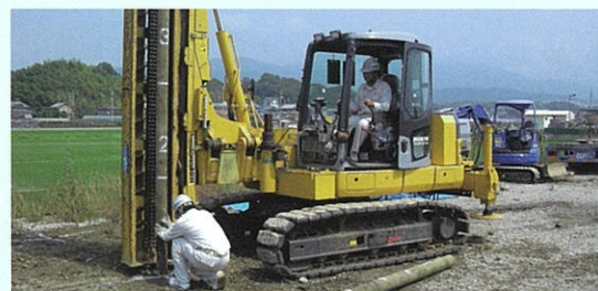
国土交通省の新技术情報提供システム (NETIS) に登録 KT-200101-A